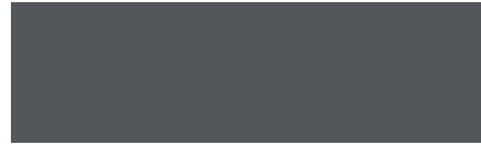
PANTONE Cool Gray 11 C