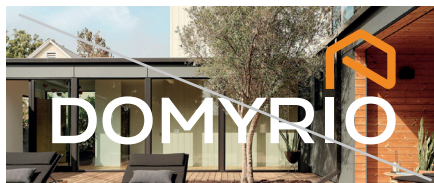
NEJEDNOTNÝ PODKLADOVÝ OBRÁZEK