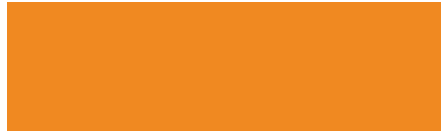
PANTONE 144 C